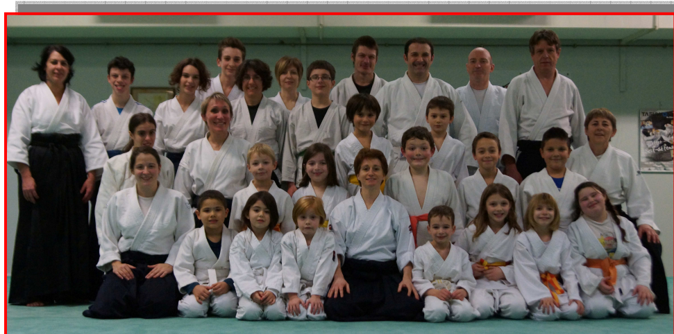
Stage inter générations de Noël Mardi 17 décembre 2013